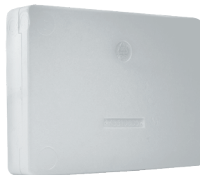
Styroporbox styrofoam interior