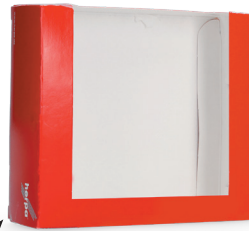
Faltschachtel folding box