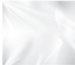
Klarsichtzuschnitt transparent window cover