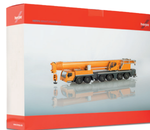
Faltschachtel folding box