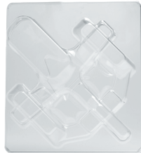
Transportsicherung safety tray